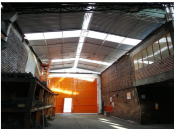
Fotografía 6. Área confinada