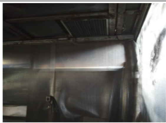
Fotografía 4. Cabina de pintura