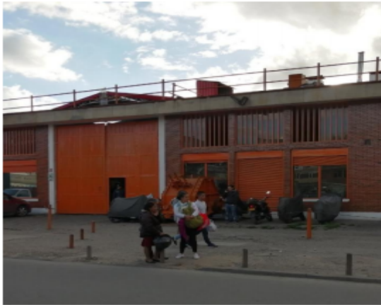
Fotografía 1. Fachada del predio

El registro fotográfico aquí presentado corresponde al tomado en la visita de campo realizada el 03 de septiembre de 2019 y acogida en el concepto técnico 02714 del 17 de febrero de 2020.