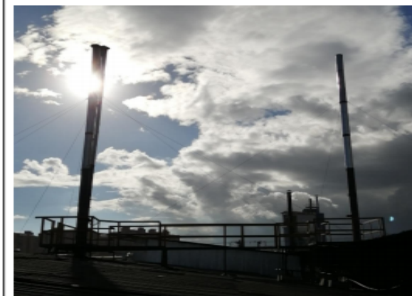
Fotografía 5. Ductos de los hornos de temple