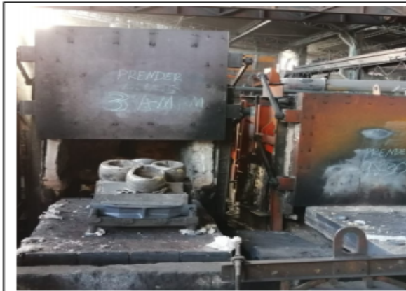
Fotografía 3. Horno de temple