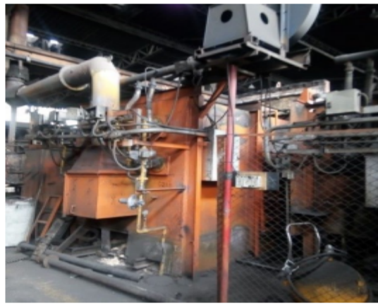
Fotografía 2. Horno de temple